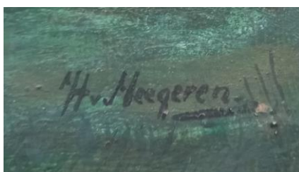
Tableau Symboliste en Gouache Bleu et Vert Signé Han Van Meegeren